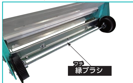
写真:K-60WTS(縁ブラシ付き)

2輪駆動(従来機種)に比較してスリップしにくく、より安定した播種・覆土が行えます。